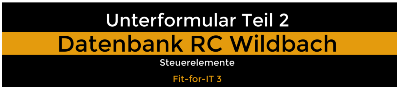
Abb. 03: Startbild des Videotutorials Unterformular Teil 2

Im zweiten Teil des Videotutorials wird gezeigt, wie man Steuerelemente, wie das Listenfeld und das Datumsfeld einfügt, die die Bedienbarkeit des Formulars wesentlich verbessern: