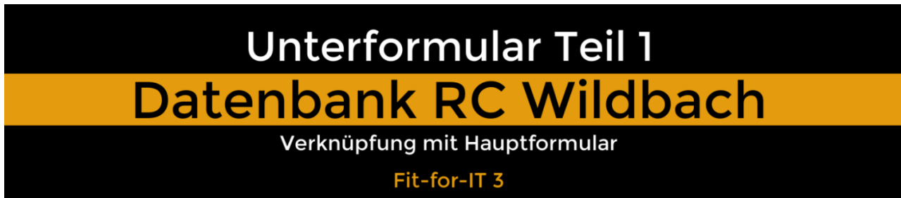
Abb. 02: Startbild des Videotutorials Unterformular Teil 1

Wie man mithilfe eines Assistenten ein Hauptformular erstellt, das mit einem Unterformular verknüpft ist, kannst du mit Hilfe dieses Videotutorials nachvollziehen: